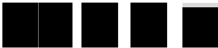
2/1-sidor (2x) 208 x 278 mm + 5 mm utfall Pris: 129.000 kr